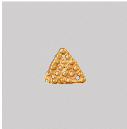
ил. 8. Треугольная бляшка.