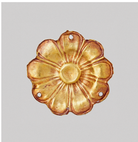
fig. 9. Plaque in the shape of a nine-petal rosette. Northern Black Sea region, 4 th century B.C. Gold; stamping. Moscow Kremlin Museums. Inv. no. МР–10032

бляшка известна и в коллекции Д.И. и И.И. Толстых; еще один экземпляр подобной бляшки хранится в Британском музее. Описываемые бляшки относятся к двум вариантам в соответствии с системой крепления: 1) с отверстиями по углам; 2) с петельками для крепления по углам на обороте [Журавлев, Новикова, Шемаханская, 2014. С. 127]. Бляшка из коллекции Л.К. Зубалова в Музеях Кремля относится к первому типу. Как отмечают авторы монографии, вводящей в научный оборот материалы коллекции из кургана Куль-Оба, хранящиеся в Государственном историческом музее, «близкие бляшки найдены и в других погребениях скифской знати: Чертомлык, Толстая Могила, Деев курган, Огуз, Мелитопольский курган, Солоха, Гайманова Могила, курган группы Пять братьев, Елизаветинский курган, курган Патиниоти. В кургане Солоха подобные бляшки были, вероятно, нашиты на штаны погребенного, поскольку обнаружены вдоль костей ног. В Малой Лепетихе (курган 9) подобными бляшками был украшен головной убор. Эта же традиция фиксируется и в ряде других памятников. В качестве деталей украшения [они] использовались и в более позднее время, вплоть до первых веков н.э. Подобные бляшки имеют широкую датировку – IV в. до н.э.» [Журавлев, Новикова, Шемаханская, 2014. С. 127].