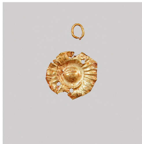
ил. 11. Бляшка в виде девятилепестковой розетты (обрезанная).

fig. 10. Plaque in the shape of a nine-petal rosette (cut). Northern Black Sea region, 4 th century B.C. Gold; stamping. Moscow Kremlin Museums. Inv. no. МР–10013