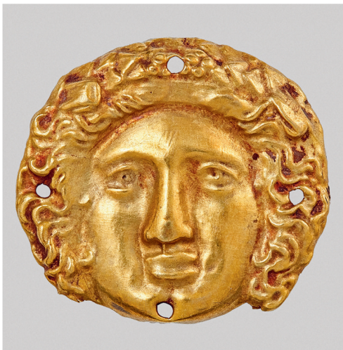
ил. 1. Бляшка с изображением головы Диониса.

Северное Причерноморье, IV в. до н.э. Золото; тиснение.