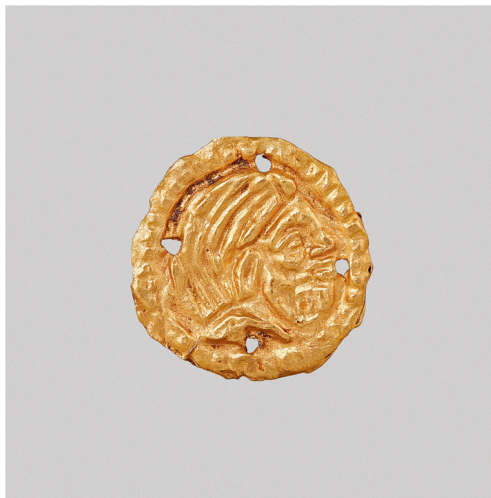
ил. 5. Бляшка с изображением мужской головы в профиль.