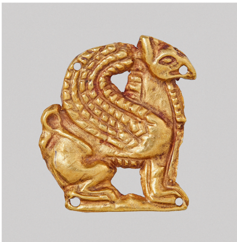
ил. 7. Бляшка в виде грифона.