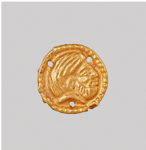
ил. 6. Бляшка с изображением мужской головы в профиль.

fig. 5. Plaque with an image of a man's head, profile. Northern Black Sea region, 4 th century B.C. Gold; stamping. Moscow Kremlin Museums. Inv. no. МР–10038