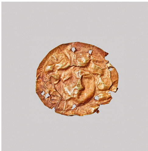
ил. 3. Бляшка с изображением женского лица анфас.

fig. 2. Plaque with an image of a woman's head, full-face. Northern Black Sea region, 4 th century B.C. Gold; stamping. Moscow Kremlin Museums. Inv. no. МР–10045