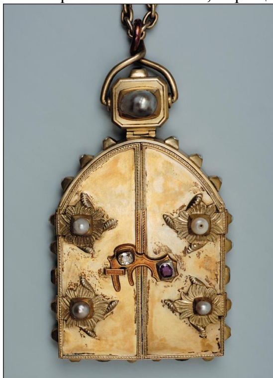
1. Складень. Москва, 1863. Музеи Московского Кремля. Вид с закрытыми створками

Макария в середине XVII века: «У всех ратников без исключения непременно имеется на груди красивый образ в виде тройного складня, с которым он никогда не расстаётся, и где бы ни остановился, ставит его на видном месте и поклоняется ему» 2 . Часто владельцы складней заказывали мастеру определенные изображения. Молитва, обращенная к Богу, приоб-