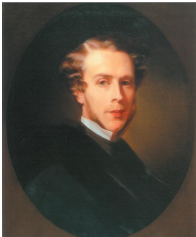
9. К.П. Брюллов. Портрет графа П.С. Строганова. 1850. Тамбовский художественный музей

угодя, где выращивали рожь и пшеницу, скотную ферму, конный завод, фруктовые сады. На выставке в 1889 г. хозяйство получило «большую бронзовую медаль за семена от Императорского вольного экономического общества» 15 .