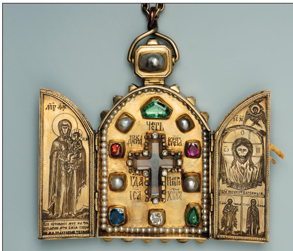
4. Складень. Вид с открытыми створками

О заказчиках складня напоминают не только образы соименных святых, но и родовые гербы на оборотной стороне золотого ковчега (ил. 7). Над вкладной надписью изображены гербы двух знатных и богатых семейств России — Строгановых и Бутурлиных. Оба помещены под короной, правый щит — герб Бутурлиных — держит «венгерец», левый — герб Строгановых — черный соболь. На гербе рода Строгановых в центре на щитке изображены российский двуглавый орел и графская корона. Внешние створки складня украшены накладными золотыми цветками с сердцевинами-жемчужинками и запираются изящной застежкой с рубином и бриллиантом.