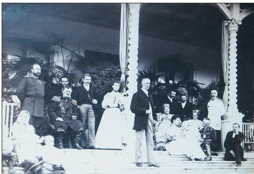
10. Прием в тамбовском имении Строгановых. Фотография 1900-х гг. Тамбовский краеведческий музей