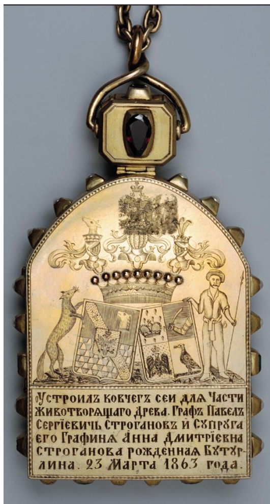
3. Складень. Обратная сторона

подчеркивают их природную красоту и цвет — это розовые альмандины, два гиацинта, разной формы изумруды, сапфир и сияющие бриллианты. Петербургские ювелиры уже с XVIII в. предпочитали использовать в обрамлении «короля камней» — бриллианта — нейтральное серебро и избегали массивных оправ. В складне Строгановых все самоцветы и бриллианты имеют золотые касты, которые выделяют уникальность каждого камня.