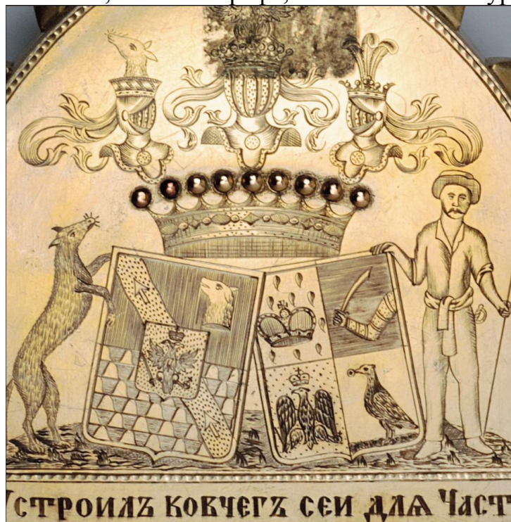
7. Гербы на оборотной стороне складня

железодельных заводов и два чугуноплавильных, золотые прииски в Перми, двенадцать соляных варниц. Он выплатил братьям по миллиону рублей отступных и присоединил к своей вотчине около восьмисот тысяч десятин земли 6 . Многие, знавшие графа, отмечали его аккуратность в