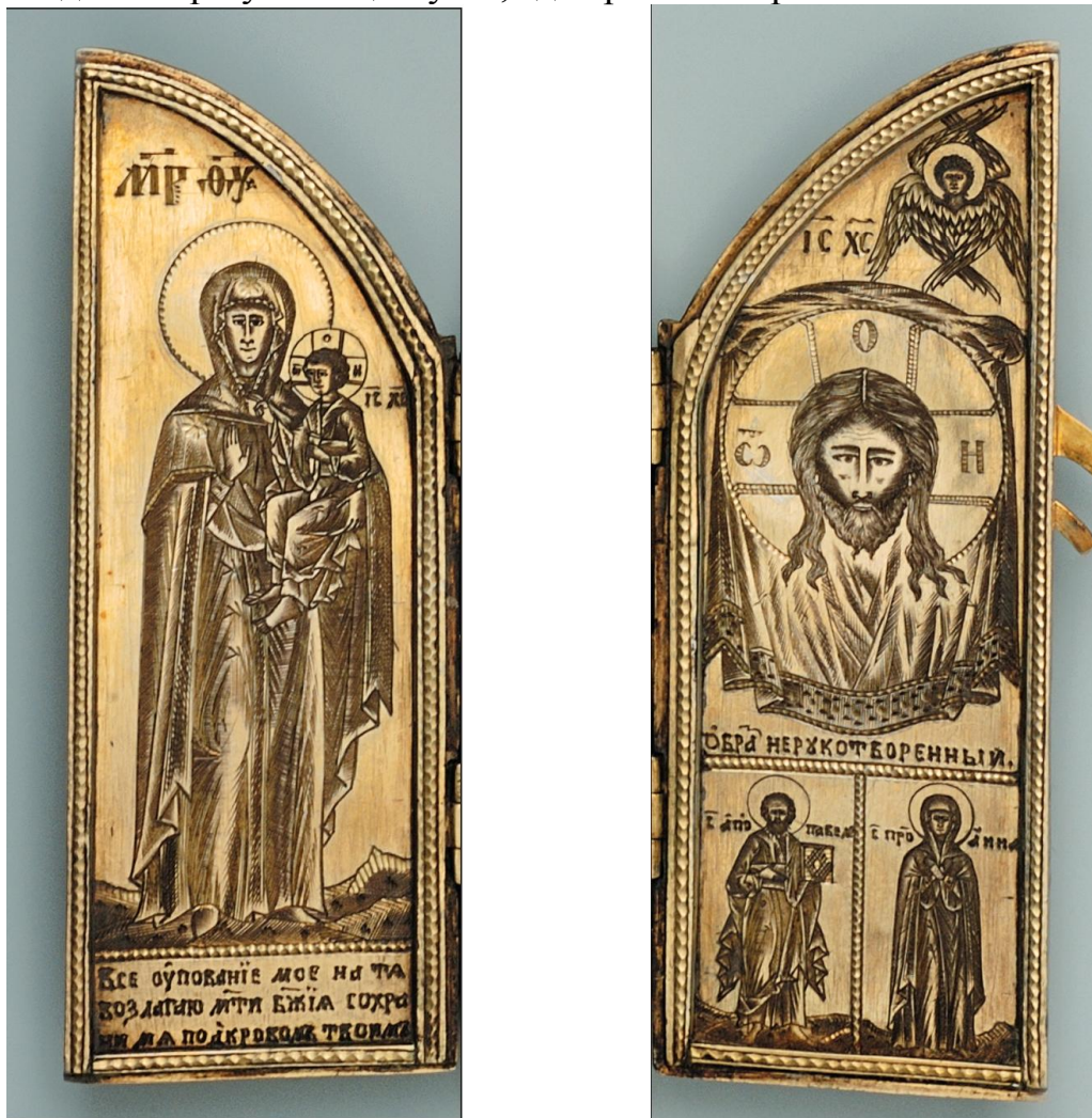
5—6. Левая и правая створки складня

личных средств в обустройство и оснащение этого учебного заведения, а также в создание при училище музея, где хранились различные