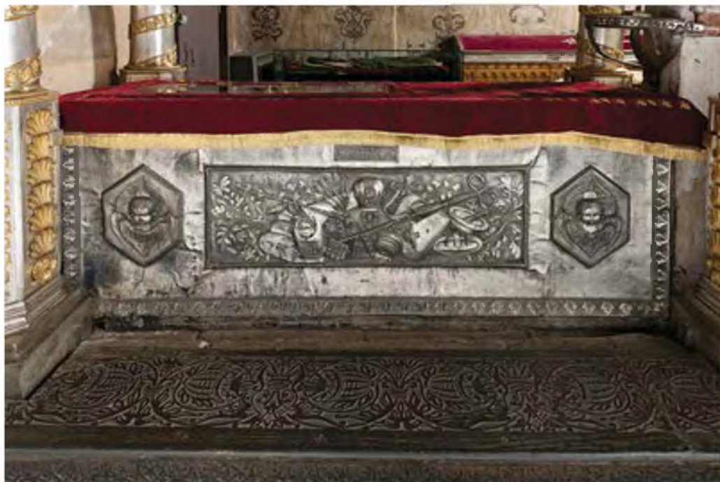
2. Рака митрополита Петра