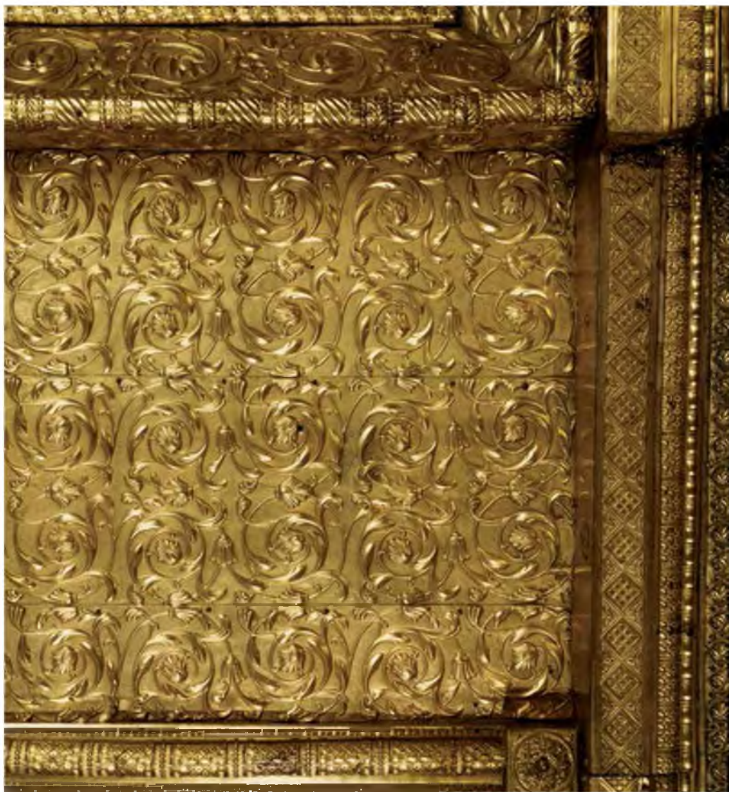
8. Иконостас у северной стены Успенского собора.