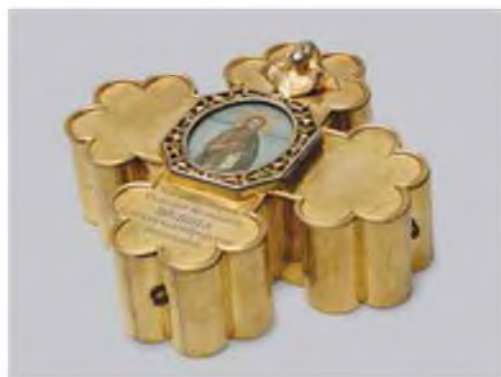
6. Ковчег для мощей Иоанна Крестителя