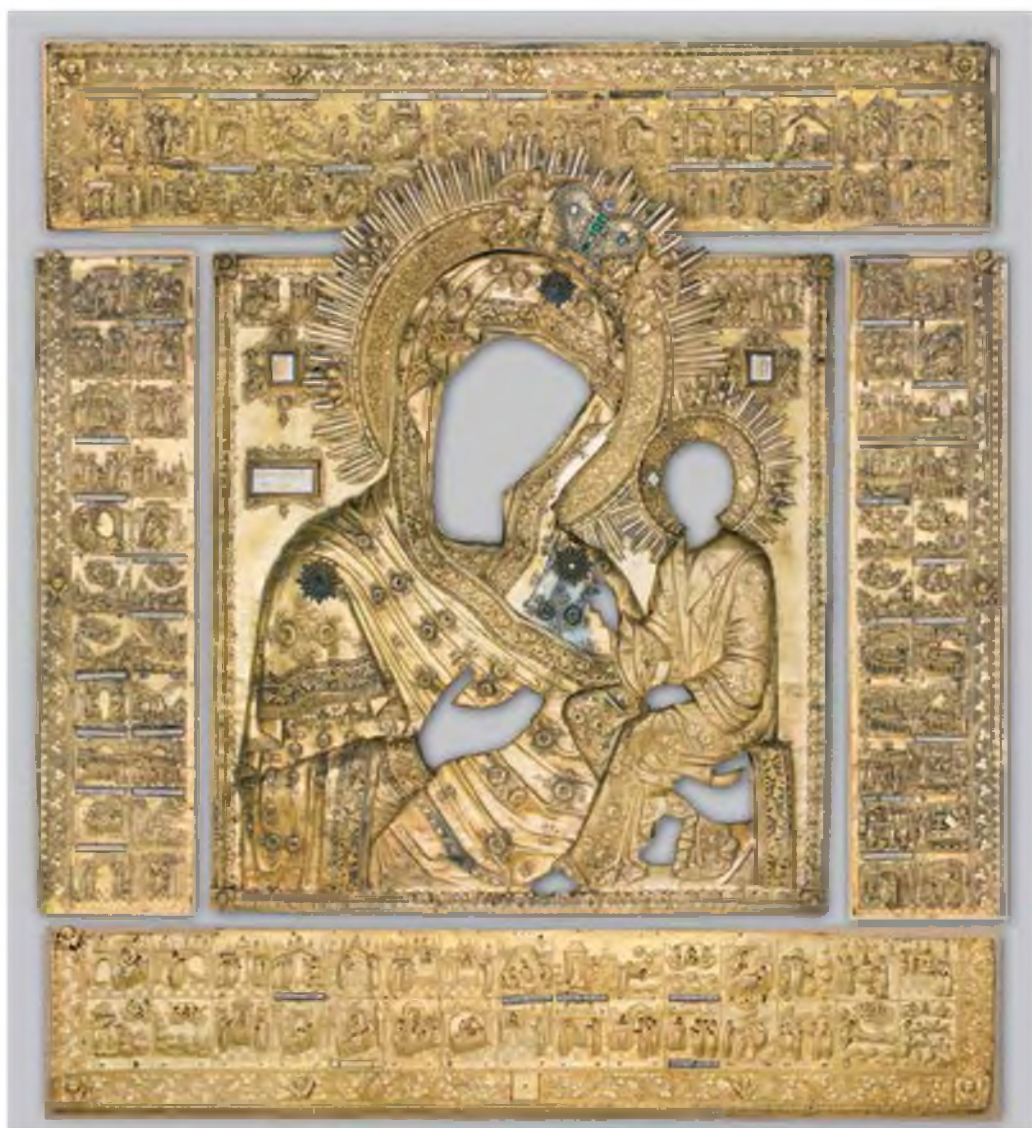
11. Оклад на икону «Богоматерь Тихвинская»