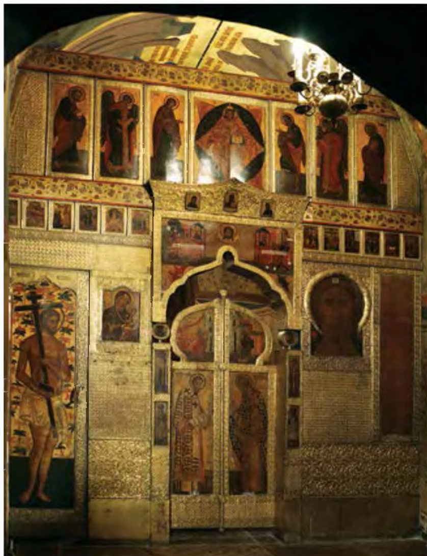
10. Иконостас придела Димитрия Солунского