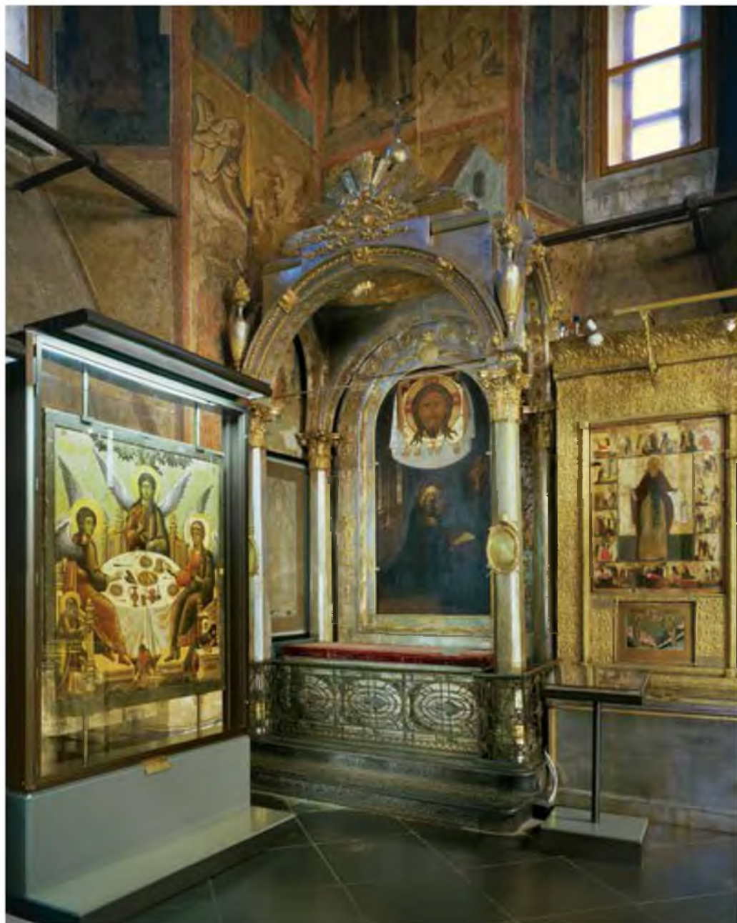
1. Рака митрополита Ионы, с сенью